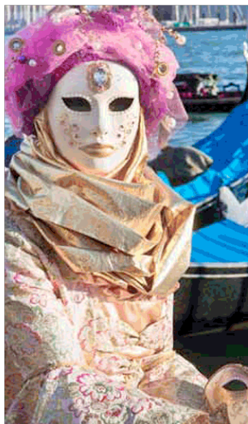
Sopra, i carri allestiti in occasione del Carnevale di Viareggio (Lu). In basso, una maschera del Carnevale di Venezia

Info: www.wintermarathon.it www.alpedisiusi.info www.viareggio.ilcarnevale.com www.carnevale.venezia.it