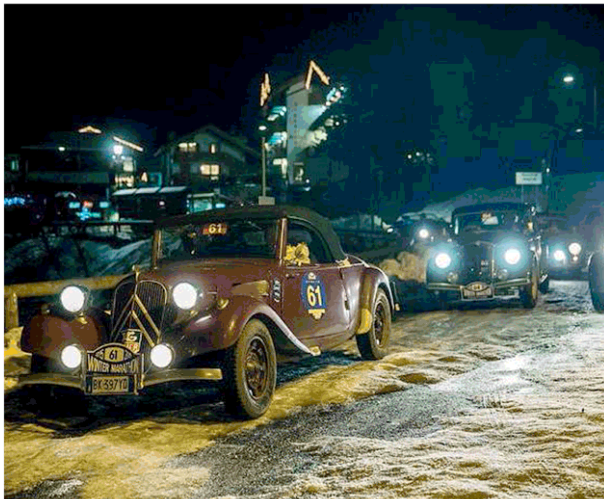
Fari nella notte. Uno scorcio della scorsa edizione. La gara prevede la guida per 12 ore consecutive