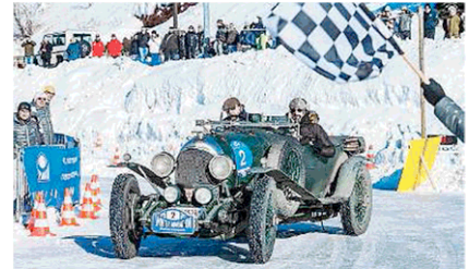
Anteguerra. Una vettura degli anni Trenta impegnata nelle prove sul laghetto ghiacciato di Madonna di Campiglio