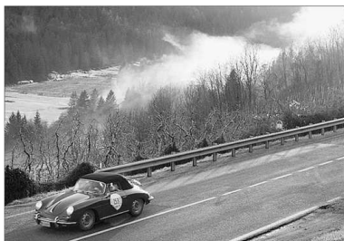
Alcuni momenti della bella edizione della Winter Marathon 2008 lungo i passi dolomitici. Notevoli le difficoltà dovute al fondo ghiacciato