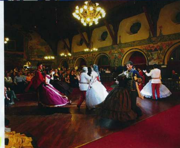
Dall'alto in senso orario: la cima Grotte, 2.500 metri; il panorama di Madonna di Campiglio; un falò sulla neve; un ballo in maschera per il Carnevale Asburgico nel Salone Hofer dell'hotel Relais Des Alpes di Madonna di Campiglio; una veduta del rifugio Patascoss in Val Rendena.